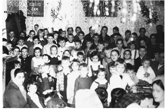
Праздник Рождества Христова в молитвенном доме на ул. Цимлянской, 12