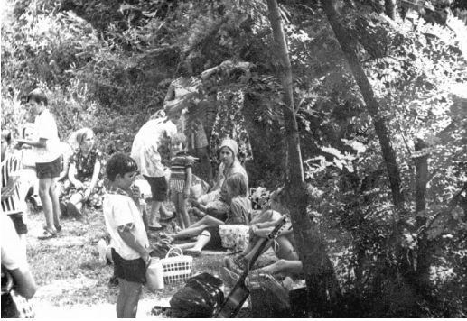
...А теперь можно и отдохнуть