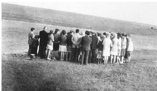
Крещение на Хаджибейском лимане 8 августа 1976 г.

В Пересыпской церкви от начала ее существования и донныне крещение новообращенных происходит в открытых водоемах. Во-первых, это свидетельство о Господе окружающим людям, а во-вторых, вся природа становится свидетелем того, что люди поверили в Господа Иисуса Христа как личного Спасителя и обещают быть верными Богу до конца своей жизни.