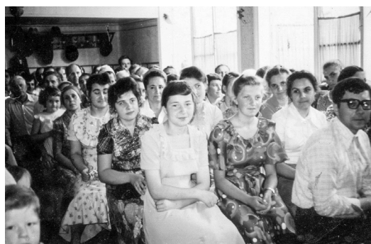
Во время богослужения в молитвенном доме на ул. Цимлянской, 12

Братья и сестры полюбили эти общения и при обсуждении библейских текстов получали