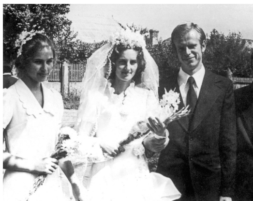
После бракосочетания 5 сентября 1976 г.