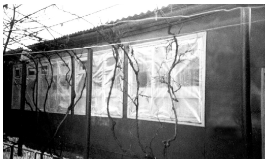
Левая стена молитвенного дома в зимнее время года Конец 1970-х гг.

В 1975 г. церковь приняла решение построить легкое строение для собраний на Пересыпи,