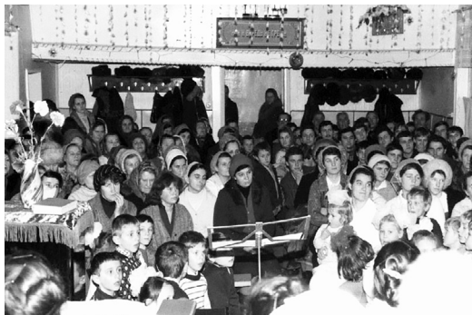
Во время богослужения в молитвенном доме по ул. Цимлянкой, 12. 1970-е гг.

Зал был рассчитан на 200 человек, над входом находился небольшой балкон. Когда не хватало мест в зале, на балконе обычно сидели дети и молодежь.