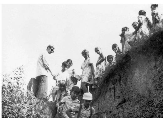
Дети направляются на отдых к берегу Куяльницкого лимана