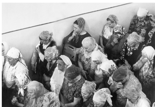
Молитва после церковного разбора Слова Божьего