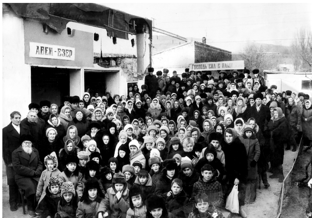
Пересыпская церковь на месте разрушенного молитвенного дома. 1986 г.

Пересыпи вновь появилось уютное место для общений. В молитвенном доме, кроме богослужений, проходили спевки хора, молодежные общения, различные детские праздники и братские встречи.